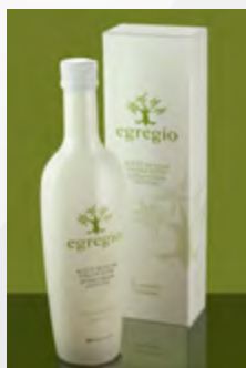
500 ml Estuche / gift box